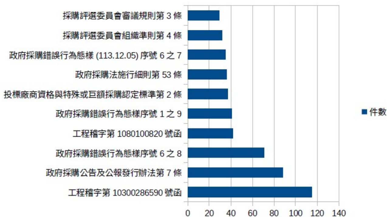
圖 3 稽核案件違反採購法相關法條或有瑕疵情形(違反法令條款)件數統計圖

與 113 年比較，缺失件數下降項目為政府採購錯誤行為態樣序號 1 之 9、投標廠商資格與特殊或巨額採購認定標準第 2 條、採購評選委員會組織準則第 6 條、政府採購法第 50 條第 1 項第 6 款、政府採購錯誤行為態樣序號 1 之 16、政府採購錯誤行為態樣序號 6 之 8。說明廠商資格設定、評選委員名單公開及機關因廠商投標文件影響公平性，經機關於開標前發現者，廠商其所投之標應不予開標等違法或有瑕疵案件量降低。